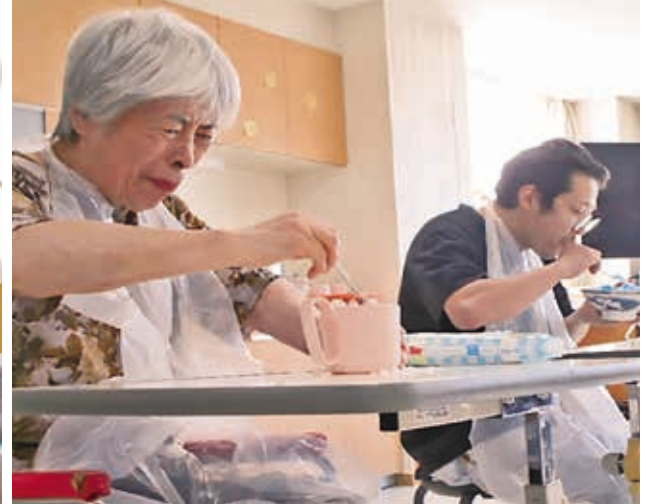
▲ 利用者 VS 職員 ▲ かき氷早食い対決