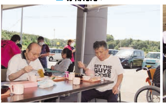
▲ 皆さんの箸がとまりません ▲