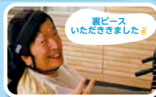
裏ピース いただきました