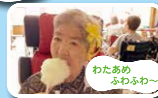
わたあめ ふわふわ~