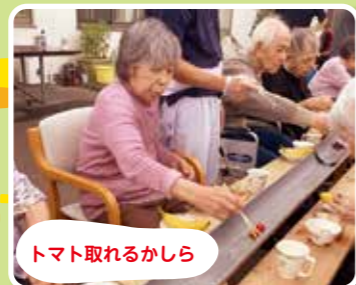
トマト取れるかしら