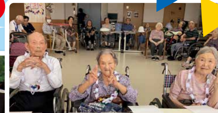
ゲーム&カラオケ大会で大盛り上がり!