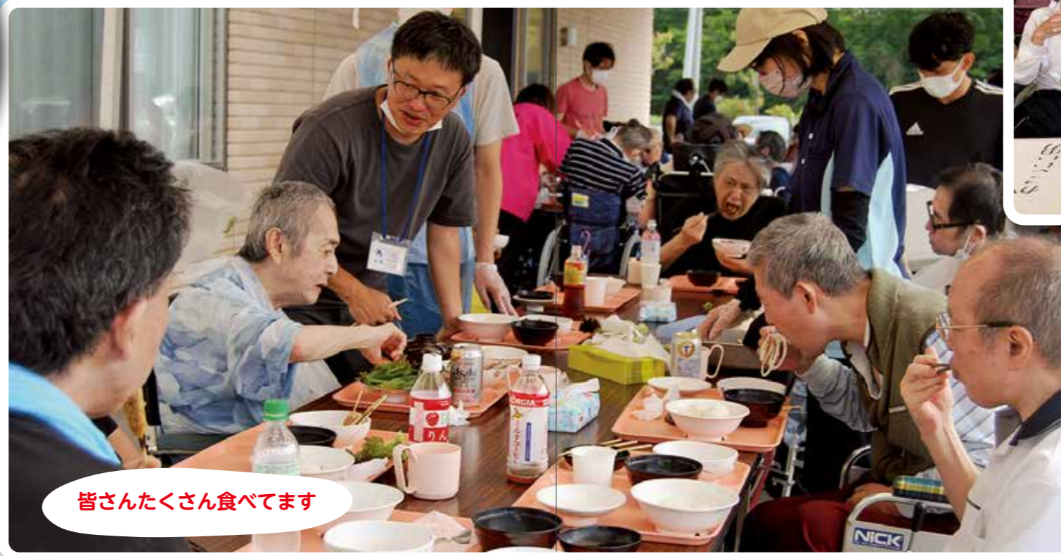
皆さんたくさん食べてます