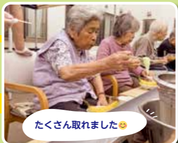
たくさん取れました