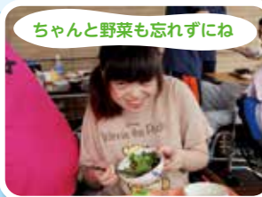
ちゃんと野菜も忘れずにね