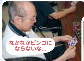
なかなかビンゴにならないな...